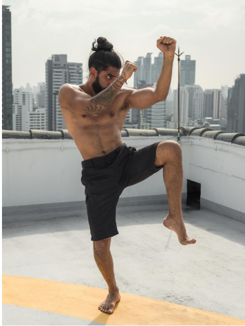
Karaté et Krav-Maga scéances de 20 mn alternées entre les 2 disciplines