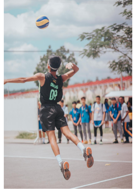
Volley - Handball et Football et Ping-Pong