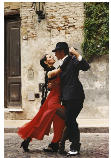
Danse de salon -