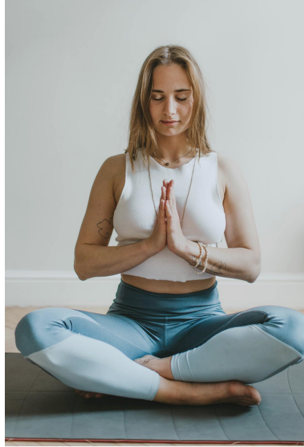
Yoga adultes (Yoga enfants scéance uniquement à 15h)