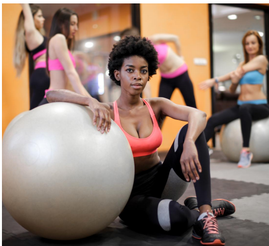
Pilates - Zumba et (Fitness à partir de 13 h)